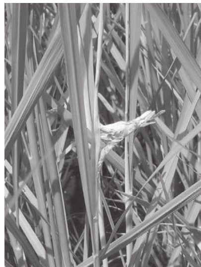
幼穂形成期以降に感染したもの